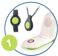
1 Lancement alarme