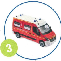
3 Intervention entourage ou secours