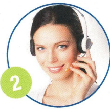
2 Dialogue et gestion urgence